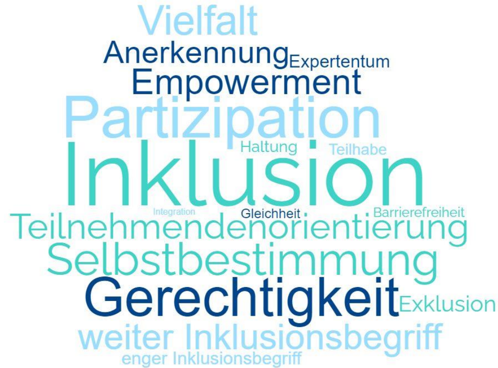
Abbildung 5: Wortwolke zur Visualisierung der gefundenen Codes. Größe abhängig davon, in wie vielen Leitbildern diese auftauchen (erstellt mit wortwolken.com).